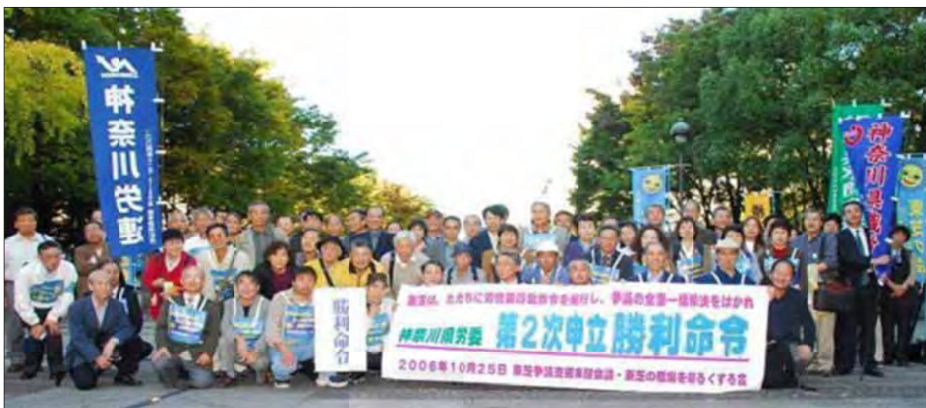
東芝賃金資格差別是正争議 第2次申立勝利命令(神奈川県労働委員会) 2006年10月25日

憲法と教育基本法の改悪に反対し、国民の生活と権利を守る貴団体に敬意を表するとともに、第2次神奈川県労委申立の勝利命令獲得にご支援いただき、厚く感謝申し上げます。