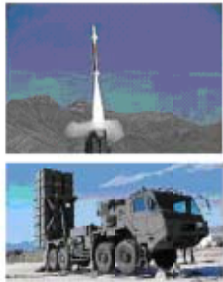
新型中距離地对空ミサイル

いま、復旧工事が大成建設等によって急ピッチですすめられています。原因の発表はありません。